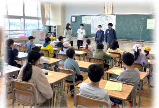
第1回地域子ども会

インフルエンザ等による2学年の学年閉鎖により、学習参観や学年懇談会を5月2日(火)に延期しました。急な変更で申し訳ありませんでした。新年度になってのお子さんや学級の様子をご覧いただきたいです。また、参観の前に学校教育ビジョン説明会も行いますので、是非、ご来校ください。