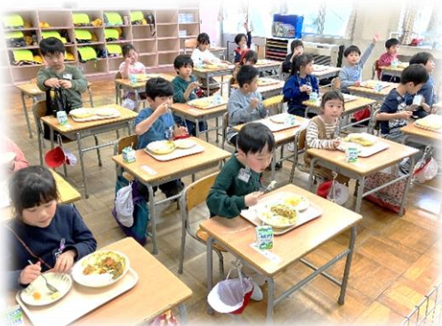
1年生 初めての給食